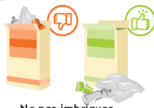
Ne pas imbriquer