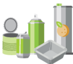
Les aérosols, bidons, boîtes de conserve, barquettes et canettes en métal