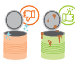
Ne pas laver