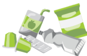
Les petits emballages en métal (capsules, couvercles, tubes, plaquettes de médicaments, boîtes sachets...)