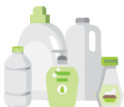
Les bouteilles et flacons