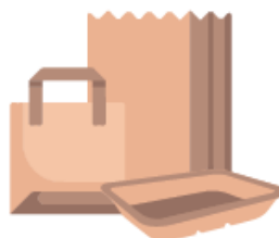
Les sacs, sachets et barquettes