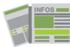
Les magazines, les journaux