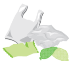
Les sacs, sachets et films