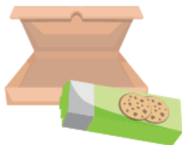
Les boîtes et cartons