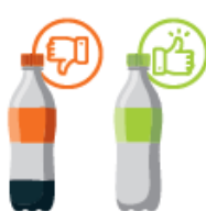
Vider le contenu