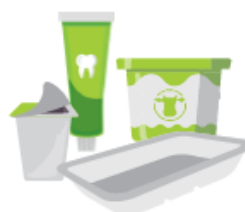
Les pots, boîtes et barquettes