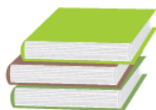
Les catalogues, les livres, les annuaires