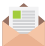
Les courriers, les lettres, les enveloppes